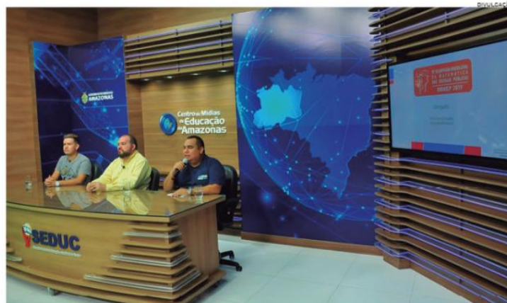
Olimpíada tem dois diferenciais: além da descoberta de novos talentos para a Matemática, também há o incentivo didático e financeiro

professores recebem capacitação especial em matemática, além de receberem bolsa (auxílio financeiro) por oito meses.