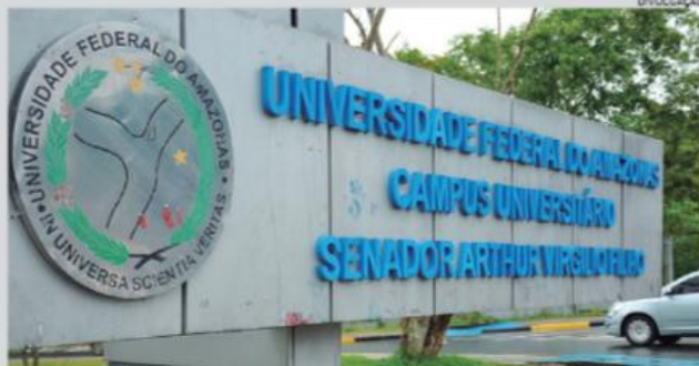
Convênio da Seduc-AM e Ufam está disponibilizando 18 vagas para mestrado a professores