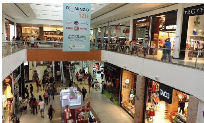
Dia Livre de Impostos acontece em três shoppings de Manaus