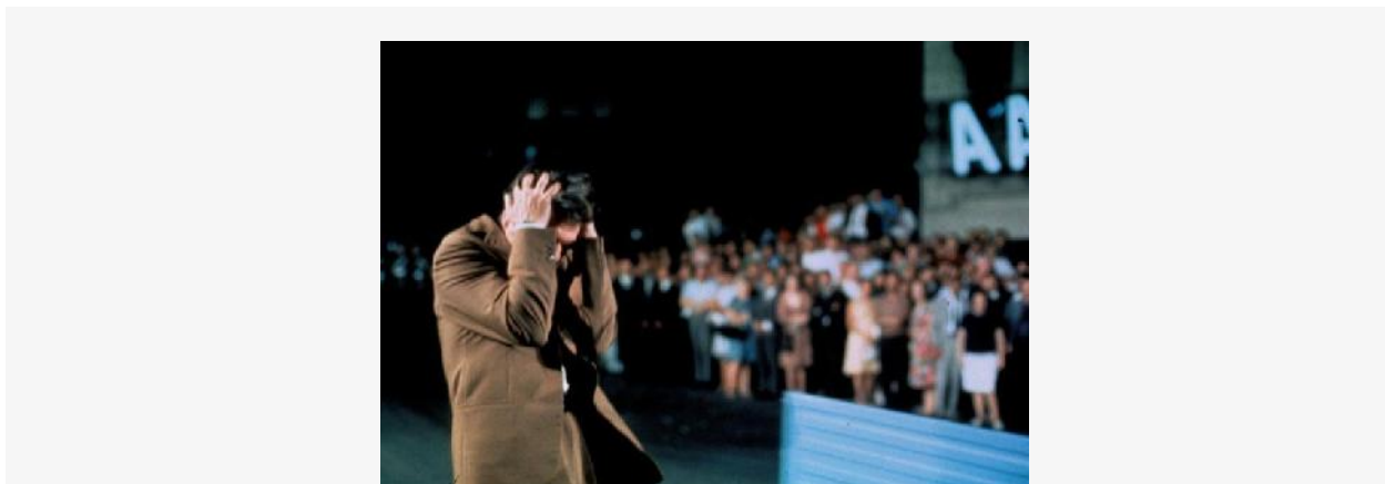
Filme Z, de Costa Gravas, é exibido na Ufam, em Manaus

A programação desta semana no Cine Vídeo Tarumã envolve três longas-metragens que discutem as diversas versões de um fato político e suas consequências. Os filmes exibidos serão "Z", "Sacco e Vanzetti" e o documentário "Risk". As sessões ocorrem na segunda (27), quarta (29) e sexta-feira (31) e são gratuitas. O Cine Vídeo Tarumã é um projeto de extensão da Ufam e funciona no auditório Rio Negro, localizado no hall do IFCHS.