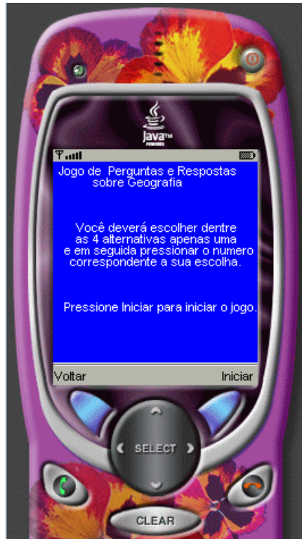
Figura 4 – Tela inicial do Jogo.

Esta classe tem apenas a função de mostrar algumas informações antes de iniciar o Jogo. Quando o aluno seleciona Novo Jogo, aparece a tela demonstrada na Figura 4. Caso o aluno selecione Iniciar, o jogo é iniciado. Caso ele selecione Voltar, aparecerá na tela o Menu novamente.