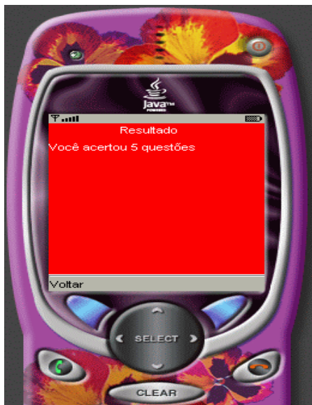
Figura 6 – Tela do Resultado.

Esta classe tem a função de mostrar o resultado do jogo, onde será possível ver quantas questões você acertou (Figura 6). Para voltar ao Menu, basta apertar no botão Voltar.