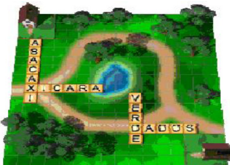
Figura 1 - Exemplo ilustrativo do Jogo Léx

O jogo é organizado em um tabuleiro, com linhas na horizontal e vertical, formando casas (Figura 1), onde as palavras serão formadas. O jogo possui também pequenos desafios que surpreendem os jogadores na hora da competição.