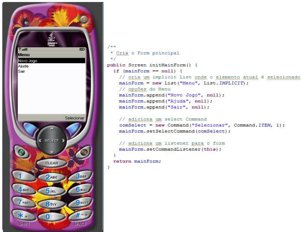
Figura 3 – Tela do Menu do Jogo e parte do código da classe MyMidlet.

Esta classe funciona como a classe principal, onde é feito o gerenciamento de todas as outras classes. Ela possui um Form, que contém uma mistura arbitrária de itens, que foi usado para fazer o Menu do Jogo. Na Figura 3 é mostrado o Menu e uma parte do código da classe MyMidlet onde este é implementado. Caso o aluno selecione Novo Jogo, aparecerão na tela do celular algumas informações de como será o jogo. Caso ele selecione Ajuda, aparecerão algumas orientações. Caso ele selecione Sair, o jogo é encerrado.