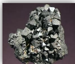
Figura 1: Magnetita.

Magnetita difere da maioria dos outros óxidos de ferro na medida em que contém tanto ferro divalente e trivalente. Sua fórmula é escrito como Y [XY] O_4 em que X = Fe^{II} , Y = Fe^{III} e os colchetes indicam os sítios octaédricos (sítios M). Oito sítios tetraédricos (sítios T) são distribuídos entre Fe^{II} e Fe^{III} , ou seja, os íons trivalentes ocupam os sítios tetraédricos e octaédricos. A estrutura consiste de octaédrica e mistas camadas tetraédrica/octaédricas empilhadas (CORNELL, 2003), conforme mostrado na figura 2: