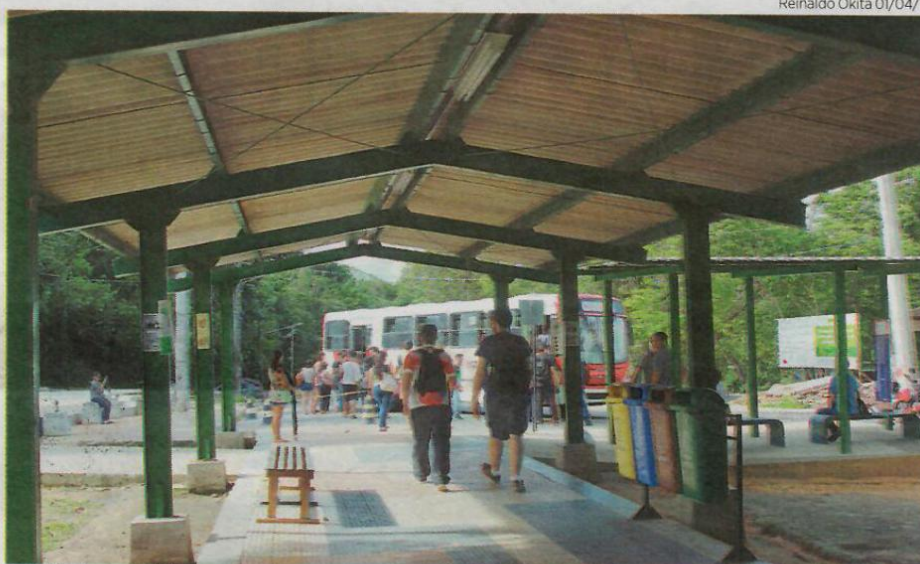
Superior Para a Ufam, foram disponibilizadas 1.894 vagas, exclusivamente, para o ano letivo de 2019

A Universidade Federal do Amazonas (Ufam) divulgou, na manhã de ontem, o resultado da terceira etapa do Processo Seletivo Contínuo (PSC) da instituição. O resultado foi, primeiramente, disponibilizado em lista no Centro de Convivência da Universidade e agora também pode ser consultado no site da Comissão Permanente de Concursos da Universidade (Compec) e também no Portal D24AM, no link: d24am.com/educacao/ufam-divulga-resulta-