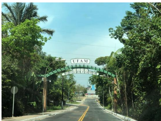
Sede da Ufam em Manaus

A Universidade Federal do Amazonas (Ufam) divulgou nesta segunda-feira (7) o resultado da terceira etapa do Processo Seletivo Contínuo (PSC) de 2019. Para o certame, foram ofertadas 1.894 vagas para o ano letivo de 2019.