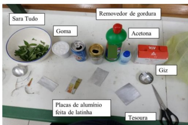
Figura 1: relação dos principais materiais.