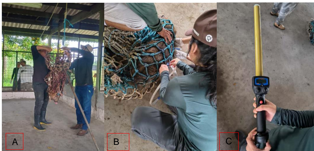
Figura 53: A-Pesagem; B-Medição; C-Leitor de microchip.

Foi realizado ainda o abate dos caititus, onde foi realizada a biometria de todos os catetos, assim como pesagem (Figura 53-A), medição de comprimento e largura dos catetos (Figura 53-B) e identificação com um leitor de microchip (Figura 53 -C). Os animais abatidos foram levados para o frigorífico da fazenda, uma vez que a insensibilização e sangria foi realizada no próprio setor(Figura 54).