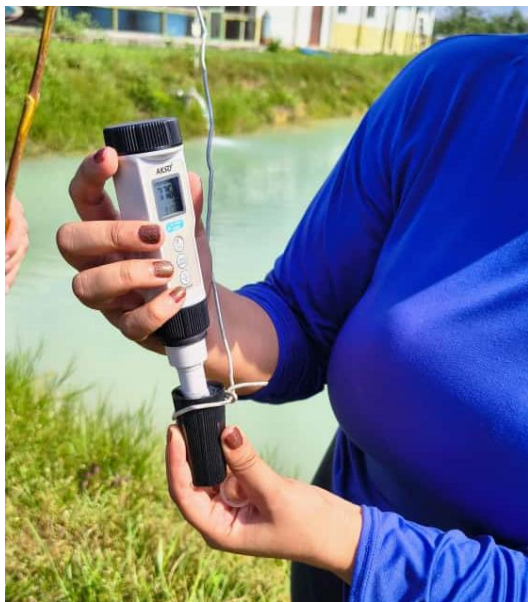
Figura 61: Medição do pH.