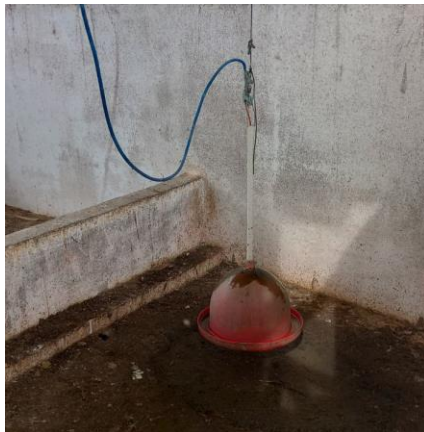
Figura 20: Comedouro do tipo tubular.