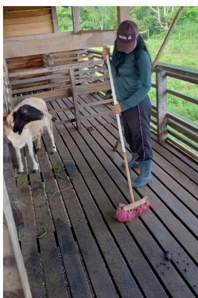
Figura 34: Limpeza do assoalho.