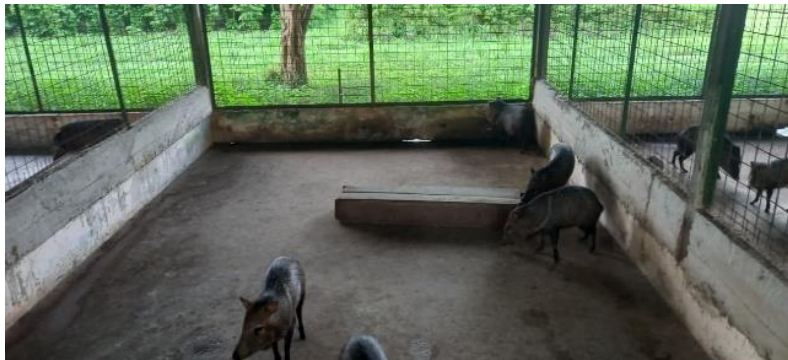
Figura 52: Cocho protegido.

Realizava-se a limpeza das baias ao fim do dia, onde eram retirados os dejetos, e por vezes, resto de alimento. Para isso, utilizava-se uma vassoura, uma pá e uma caixa plástica. Ainda com o intuito de manter a higienização do local, os cochos (moveis) eram colocados de forma que a área interna permanecesse para baixo, evitando que os animais ficassem dentro, bem como para manter limpa, uma vez que é onde o alimento é fornecido (Figura 52).