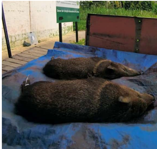
Figura 54: Catetos abatidos.