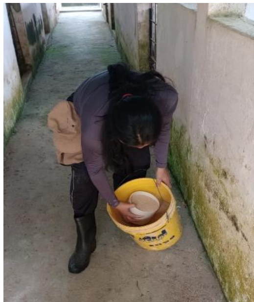
Figura 59: Fornecimento de ração.

A alimentação dos suínos era fornecida duas vezes ao dia, durante a manhã e ao fim da tarde, recebendo 2kg de ração por animal/dia (1kg/animal/trato), utilizando um balde de plástico para a distribuição da ração nos cochos. A composição da dieta tinha como ingredientes o milho, farelo de trigo e farelo de soja (Figura 59).