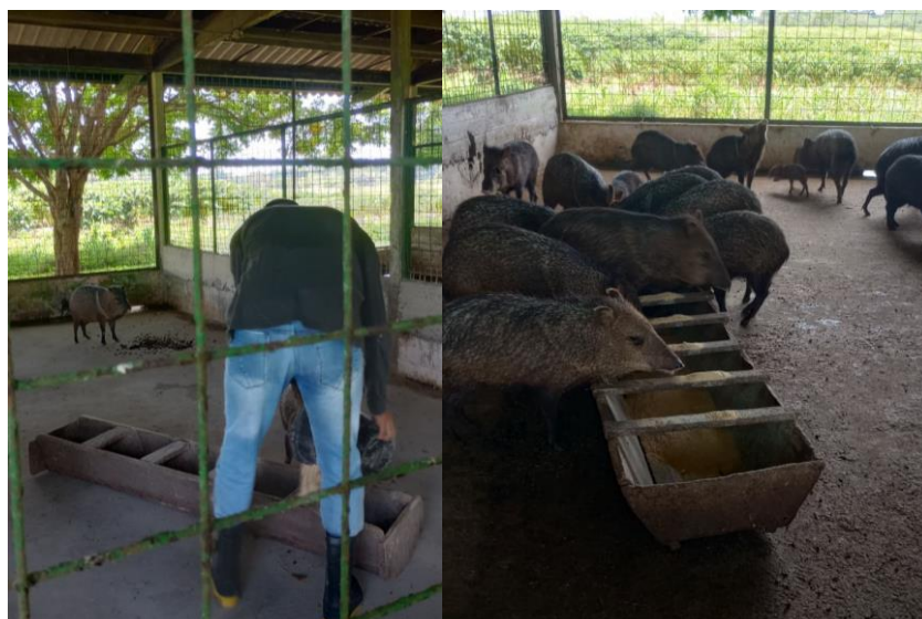
Figura 51: Fornecimento de ração.

A dieta dos catetos era composta de milho, farelo de soja, farelo de trigo e fosfato bicálcico. A alimentação era fornecida pelo período da manhã sendo 700 g para adultos e 350g para os juvenis (Figura 51).