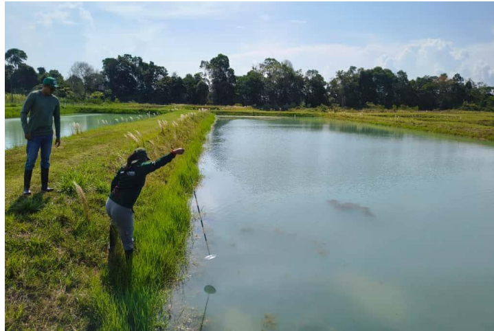
Figura 63: Disco de Secchi.