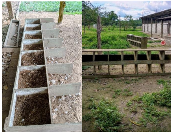
Figura 22: Área coberta (barracão).