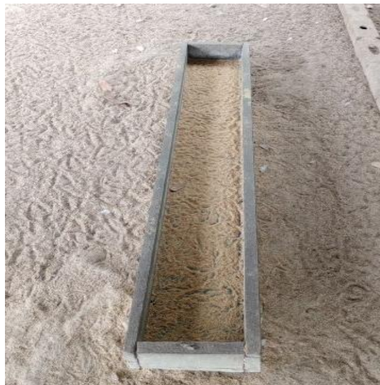
Figura 55: Ração fornecida no cocho.

O fornecimento da alimentação das aves ocorria pelo período da manhã (Figura 55), a dieta das galinhas era composta de milho, farelo de soja, fosfato bicálcio, calcário fino, calcário grosso e sal, sendo fornecido para o plantel 11 kg por dia, com o consumo diário por ave de 120g/ave/dia . No entanto, para os patos a dieta era composta por milho, farelo de soja, fosfato bicálcico, calcário e sal, sendo oferecidos 12 kg de concentrado ao dia com o consumo diário por animal de 180g/ave/por dia.