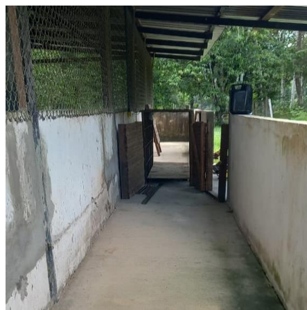
Figura 28: Corredor de manejo.

Há também um corredor de manejo, utilizado para auxiliar no direcionamento para a área de pesagem (Figura 28), bem como um pedilúvio com cal virgem (tanto na entrada quanto saída), tendo a função de desinfetar os calçados dos tratadores e pessoas que frequentam o local para a realização de pesquisas ou aulas.