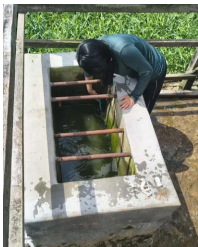
Figura 47: Limpeza dos bebedouros.