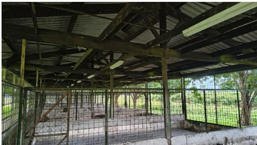
Figura 14: Setor de caititu ( Pecari tajacu ).

A FAEXP possui ainda, um setor destinado a criação de caititu ( Pecari tajacu ). A instalação destinada para os catetos possui 9 baias de uso coletivo, contendo o total de 66 animais: 41 fêmeas, 19 machos e 6 filhotes (Figura 14; Figura 15).