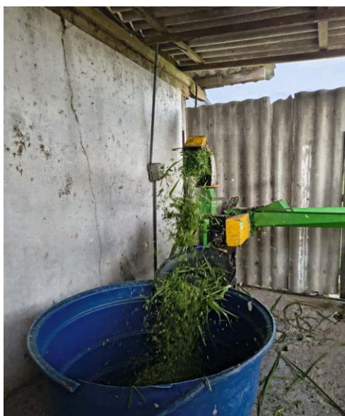
Figura 66: Capim triturado.

A silagem é um alimento volumoso obtido através de um processo anaeróbico, onde a fermentação ocorre em silos ou sacos devidamente vedados (EMBRAPA, 2021). Sendo assim, para a produção de silagem para a realização do projeto de pesquisa de uma discente do curso de zootecnia da Ufam-Manaus, foi utilizado o capim MG12 ( Megathyrsus maximus cv. ), Amendoim forrageiro ( Arachis pintoii cv. Amarello ), Java ( Macrotylona axillare cv ) e Gliricidia ( Gliricidia sepium ) (todos retirados do campo da FAEXP). Estes foram triturados, uma vez que o tamanho das partículas é de suma importância para uma boa compactação e fermentação (Figura 66).