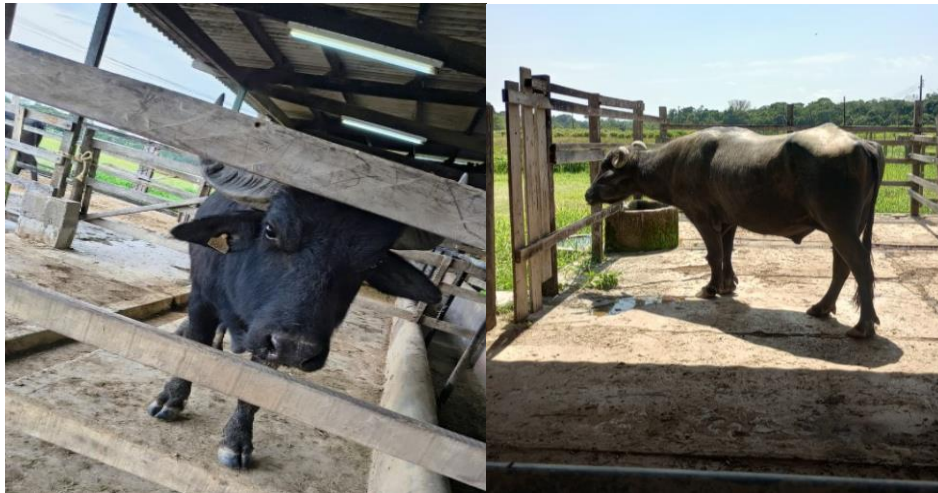
Figura 41: Reprodutores da FAEXP.