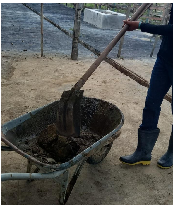
Figura 46: Carrinho de mão e pá.

Nesse contexto, era realizado a limpeza dos bebedouros em dias alternados, tanto nos bebedouros do curral (Figura 47; Figura 48) quanto do campo (Figura 49), principalmente quando observava-se grandes quantidades de sujidades. A limpeza dos bebedouros proporciona maior qualidade da água, evitando a proliferação de patógenos que podem causar doenças, e consequentemente, prejudicar o desempenho animal.