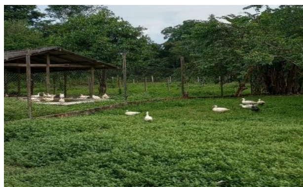
Figura 23: Área cercada e sombreada.

O aviário possui uma área externa cercada e sombreada (figura 23), onde ambas espécies ficam soltas durante o dia.