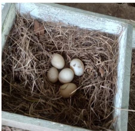
Figura 57: Ovos coletados.