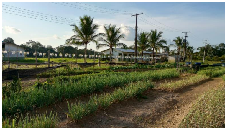
Figura 65: Hortaliças adubadas com adubo da fazenda.