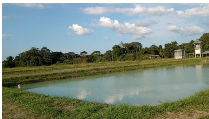
Figura 31: Viveiros.

O setor de piscicultura conta com o total de 26 viveiros, mas apenas 12 estavam ativos, sendo 2 deles destinados a produção de peixes para alimentação dos alunos, contendo especialmente a criação de tambaqui. O restante dos viveiros para a realização de pesquisas e ensino. Vale ressaltar ainda que, o setor também contava com as espécies de matrinxã e pirarucu nos demais viveiros (Figura 31).