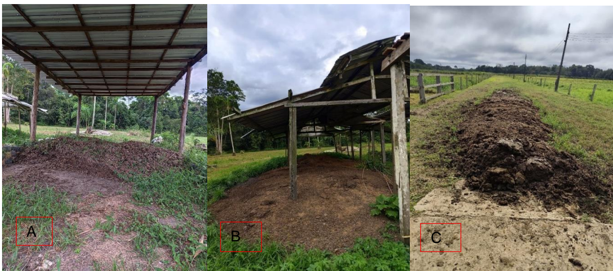
Figura 64: Esterqueiras- aves (A); caititu (B); bubalino (C).

A limpeza e retirada dos dejetos ocorria em todos os setores diariamente, sendo necessário o manejo correto para proporcionar um ambiente livre de doenças e de conforto para os animais. Sob essa perspectiva, os dejetos eram transportados para as esterqueiras de cada setor (Figura 64- A aves; B caititu; C-Bubalino), onde permaneciam para o processo de decomposição, até apresentarem características adequadas (seco, com consistência fina e sem mal cheiro) para serem utilizados como adubo nas plantações da fazenda, como as hortaliças (Figura 65).