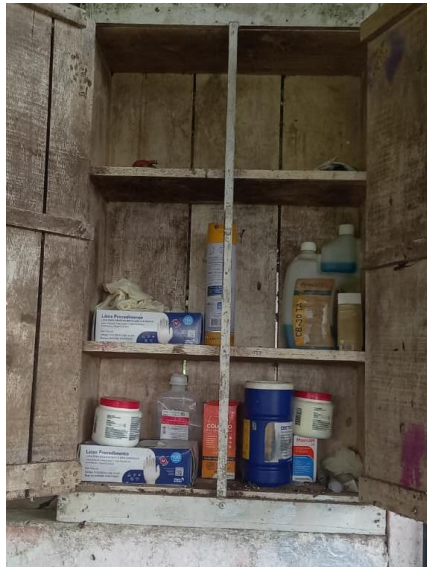
Figura 29: Armário de medicamentos.

Além disso, a instalação possui uma estrutura de descarte de dejetos (Figura 30), evitando o descarte irregular no local, que poderiam causar mal cheiro e afetar a saúde não somente dos animais como também dos tratadores. Dessa forma, os dejetos são direcionados a uma esterqueira.