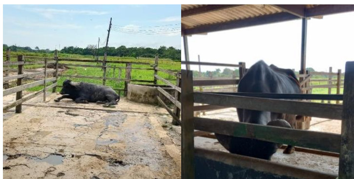
Figura 38: Animais confinados.

A alimentação no setor de bubalino é dividida entre os animais que saem para pastejo e os animais confinados (Figura 38). As novilhas e as fêmeas adultas são liberadas durante o dia para o pasto – que possui uma área de pastagem dividida em 12 piquetes (Figura 39), a espécie forrageira usada é a Urucloua decumbns –, e retornam ao curral ao fim dia. No campo há também o sal mineral disposto no saleiro com cobertura (Figura 40).