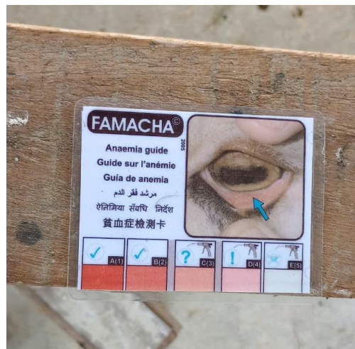
Figura 37: Ficha de avaliação do método FAMACHA.

Além disso, também foi realizado o método FAMACHA (Figura 37), um exame que se baseia no princípio da relação existente entre a coloração da mucosa conjuntiva ocular e o grau de anemia (MINHO, A. P.; MOLENTO, M. B.,2014). Nesta avaliação foi identificado uma ovelha com o estado 4, indicando que esse animal apresenta anemia, apresentando também um escore de condição corporal baixo, neste animal foi realizado a aplicação de 5ml de ferro durante 5 semanas, sendo realizada uma vez por semana.