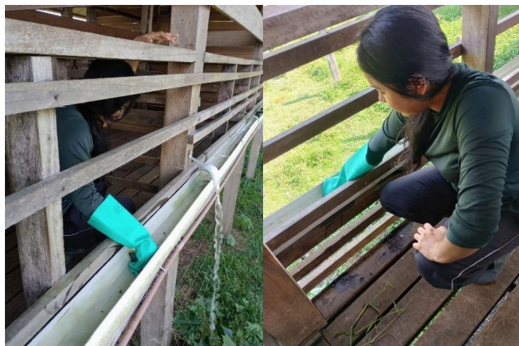
Figura 35: Limpeza dos bebedouros.

Além disso, realizou-se também a limpeza dos bebedouros diariamente, afim de melhorar a qualidade da água fornecida aos animais (Figura 35).