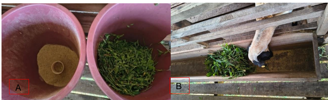
Figura 32: Alimentação dos ovinos confinados

Os ovinos recebiam alimentação tanto pela manhã quanto pela tarde (Figura 32-A). A dieta era composta do capim terra e água (sendo cortado ou triturado), milho, farelo de soja, torta de cupuaçu e sal mineral, no qual o consumo diário por animal era 600g (Figura 32-B). As ovelhas que permaneciam no pasto durante o dia, se alimentavam do capim Urochloa humidicola , bem como, sal mineral, que era fornecido no cocho nos piquetes.