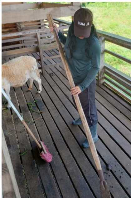
Figura 33: Limpeza com o ferro de cova.

Como forma de proporcionar o bem-estar animal, era realizado a limpeza das baias diariamente, retirando as sujidades do local que pudessem comprometer a saúde dos ovinos. Para esta atividade, era utilizado um ferro de cova (Figura 33), usado para raspagem das fezes do assoalho, e uma vassoura para a retirada dos dejetos das baias(Figura 34) Também era realizada a limpeza dos cochos, havendo a retirada das sobras de alimentos.