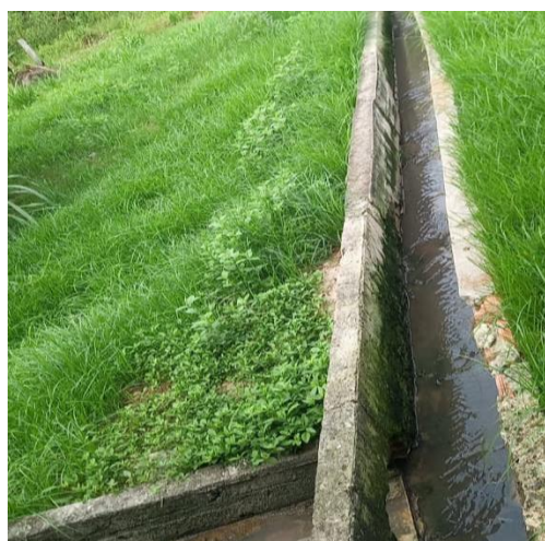
Figura 30: estrutura de descarte.

Além disso, a instalação possui uma estrutura de descarte de dejetos (Figura 30), evitando o descarte irregular no local, que poderiam causar mal cheiro e afetar a saúde não somente dos animais como também dos tratadores. Dessa forma, os dejetos são direcionados a uma esterqueira.