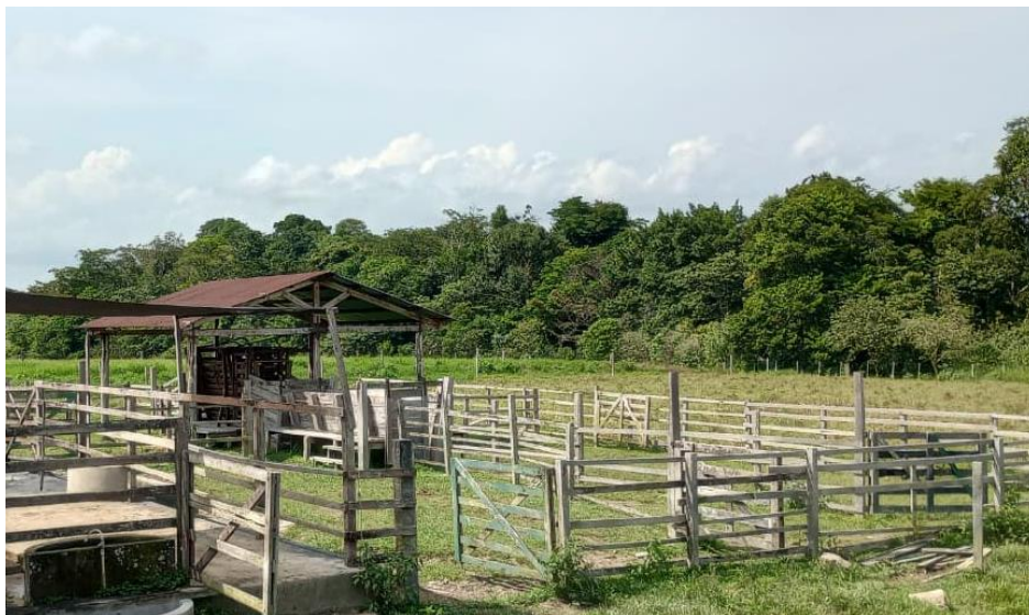
Figura 12: Curral de manejo.

No setor de bubalinos também há o curral de manejo (Figura 12), onde os animais aguardam para os procedimentos como vacinação, pesagem, diagnóstico de prenhez, entre outros. E para auxiliar nesses procedimentos há o tronco de contenção ligado a uma balança (Figura 13).