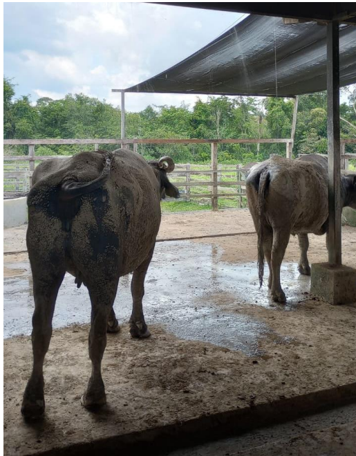
Figura 11: Sala de gestação.

No setor de bubalinos também há o curral de manejo (Figura 12), onde os animais aguardam para os procedimentos como vacinação, pesagem, diagnóstico de prenhez, entre outros. E para auxiliar nesses procedimentos há o tronco de contenção ligado a uma balança (Figura 13).