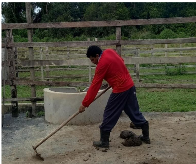
Figura 45: Limpeza da baia utilizando a enxada.