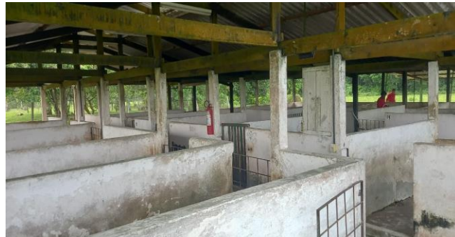
Figura 27: Bebedouro do tipo chupeta e comedouro