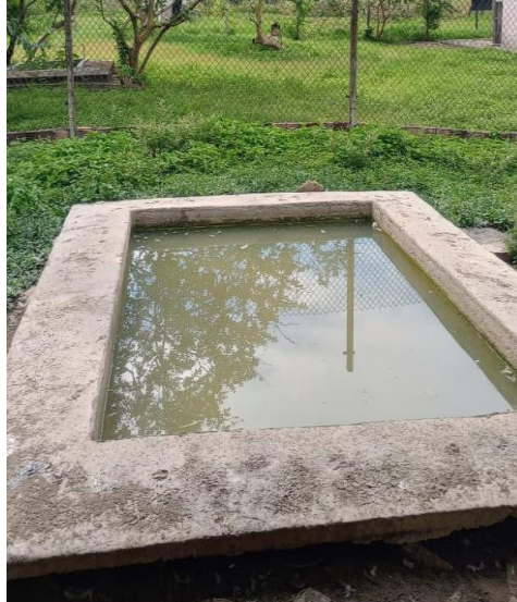
Figura 24: Piscina do aviário.

Nesta área, há uma “piscina” (figura 24), para os patos proporcionando melhor conforto térmico para estas aves, sendo realizada a limpeza duas vezes na semana objetivando evitar o excesso de sujidades. Além disso, a piscina permite que os patos possam expressar seu comportamento natural, manter a higiene e saúde das penas.