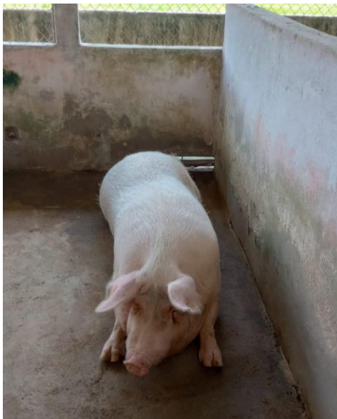
Figura 25: Suíno mestiço.

O galpão para a criação de suínos contém 16 animais adultos, sendo 3 machos e 13 fêmeas. Todos mestiços entre as raças Landrace e Large White (Figura 25).