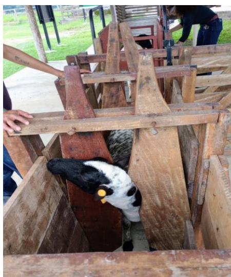
Figura 36: Coleta de fezes de ovinos.

No decorrer do estágio, alguns projetos de pesquisas estavam sendo realizados na FAEXP, dentre eles um destinado a digestibilidade das ovelhas a pasto, utilizando o método da coleta de fezes. Para isso, os animais foram colocados no tronco de contenção para facilitar a coleta (Figura 36) e as fezes foram colocadas num saco plástico e foram identificados para a análise.