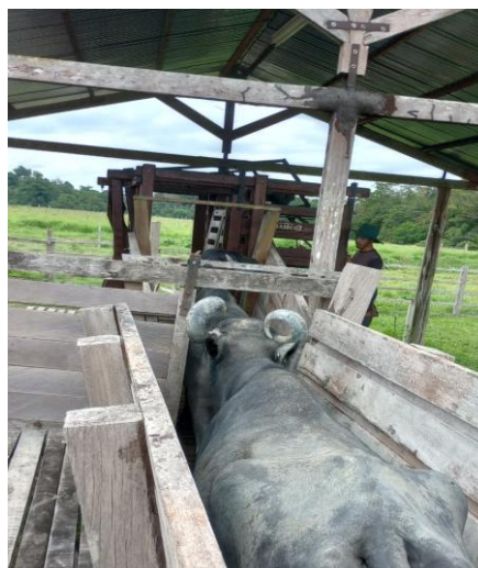
Figura 42: Búfalas sendo direcionadas ao tronco de contenção para pesagem e ultrassom.

Os principais métodos de reprodução realizados pela FAEXP, consiste em monta natural utilizando o touro da raça Murrah, e a inseminação artificial em tempo fixo (IATF). Dessa forma, houve a realização de protocolo de IATF em 8 búfalas, sendo 6 delas ficaram prenhas. Durante o estágio não foi acompanhado todo o processo do protocolo, uma vez que foi realizado anteriormente ao começo do estágio, no entanto, pode-se acompanhar o diagnóstico de prenhez. Sendo assim, as búfalas foram separadas para ultrassom e pesagem (Figura 42; Figura 43) – todas as búfalas foram pesadas-, e direcionadas para o piquete maternidade, para melhor acompanhamento da gestação, recebendo ainda a dieta com a seguinte composição: milho, farelo de soja, farelo de trigo, sal mineral e ureia. Além disso, também tive a oportunidade de realizar a ultrassom em uma das búfalas (Figura 44).