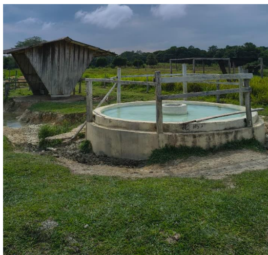
Figura 49: Bebedouro do campo.

Do mesmo modo, era realizada a limpeza dos cochos diariamente, retirando as sobras de alimento a fim de evitar a entrada de roedores e outros animais.