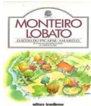
Figura 2: Livro “O sítio do Pica Pau Amarelo”

Fonte: Monteiro Lobato, Editora Brasiliense, 1920.