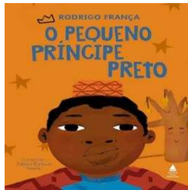
Figura 4: Livro “O pequeno príncipe preto”

Fonte: Rodrigo França, Editora Nova Fronteira, 2013.