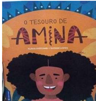
Figura 3: Livro “O tesouro de Amina”