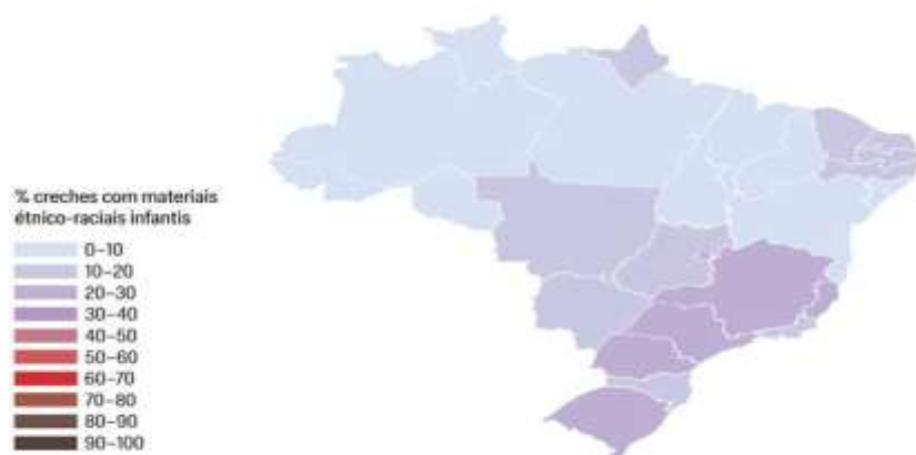
Figura 1: Mapa com dados de materiais étnico-raciais infantis nas creches no Brasil

Fonte: Censo Escolar (Inep, 2020). Elaboração AfroCebrap e Projeto Porticus (2022).