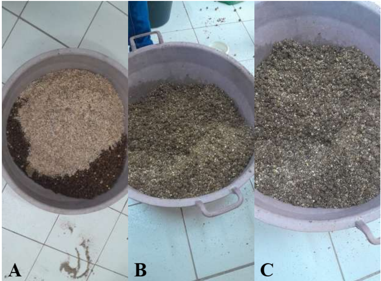
Figura 2 – A - Coproduto de Açaí com Coproduto da Colheita de Arroz; B - Com o Milho moído; C - Com Resíduo da Casca da Mandioca Desidratado.

A Imagens 2 ilustra o preparo de diferentes combinações de ingredientes utilizados para a formulação de silagem experimental. Em A , observa-se a mistura inicial composta pelo coproduto do açaí associado ao coproduto da colheita de arroz, apresentando dois materiais distintos ainda não homogenizados. Em B , a mistura passa a incorporar milho moído, que contribui para o ajuste do teor energético e para a melhoria da fermentação. Em C , o material já aparece com resíduo de casca de mandioca desidratado, resultando em uma massa mais uniforme, enriquecida e pronta para continuidade do processamento. Essas etapas representam a preparação gradual dos ingredientes até a obtenção de um composto final adequado para ensilagem em estudos de coprodutos amazônicos.