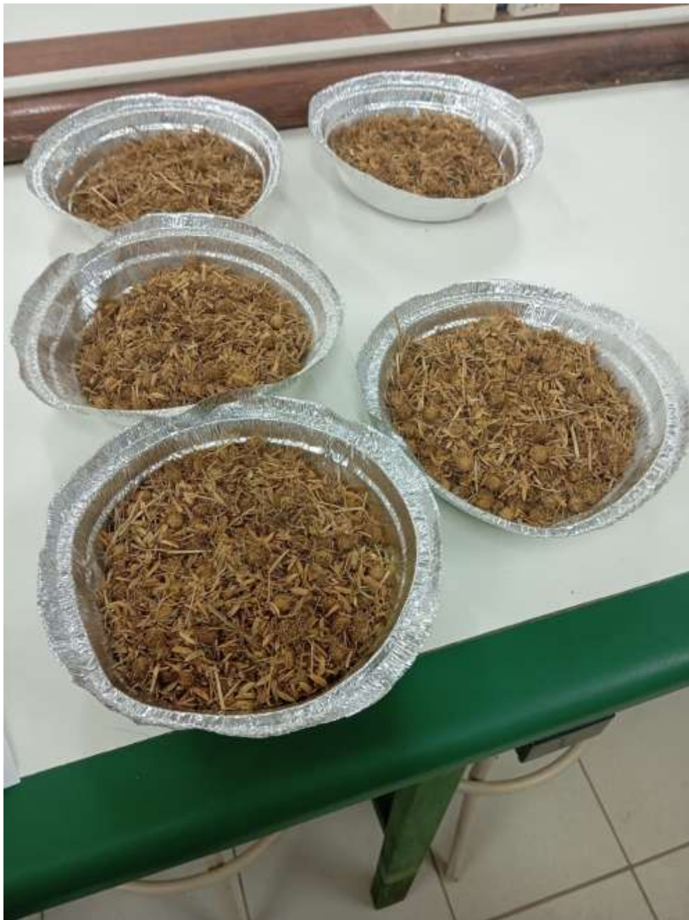
Figura 4 - Amostras para secagem após a abertura.