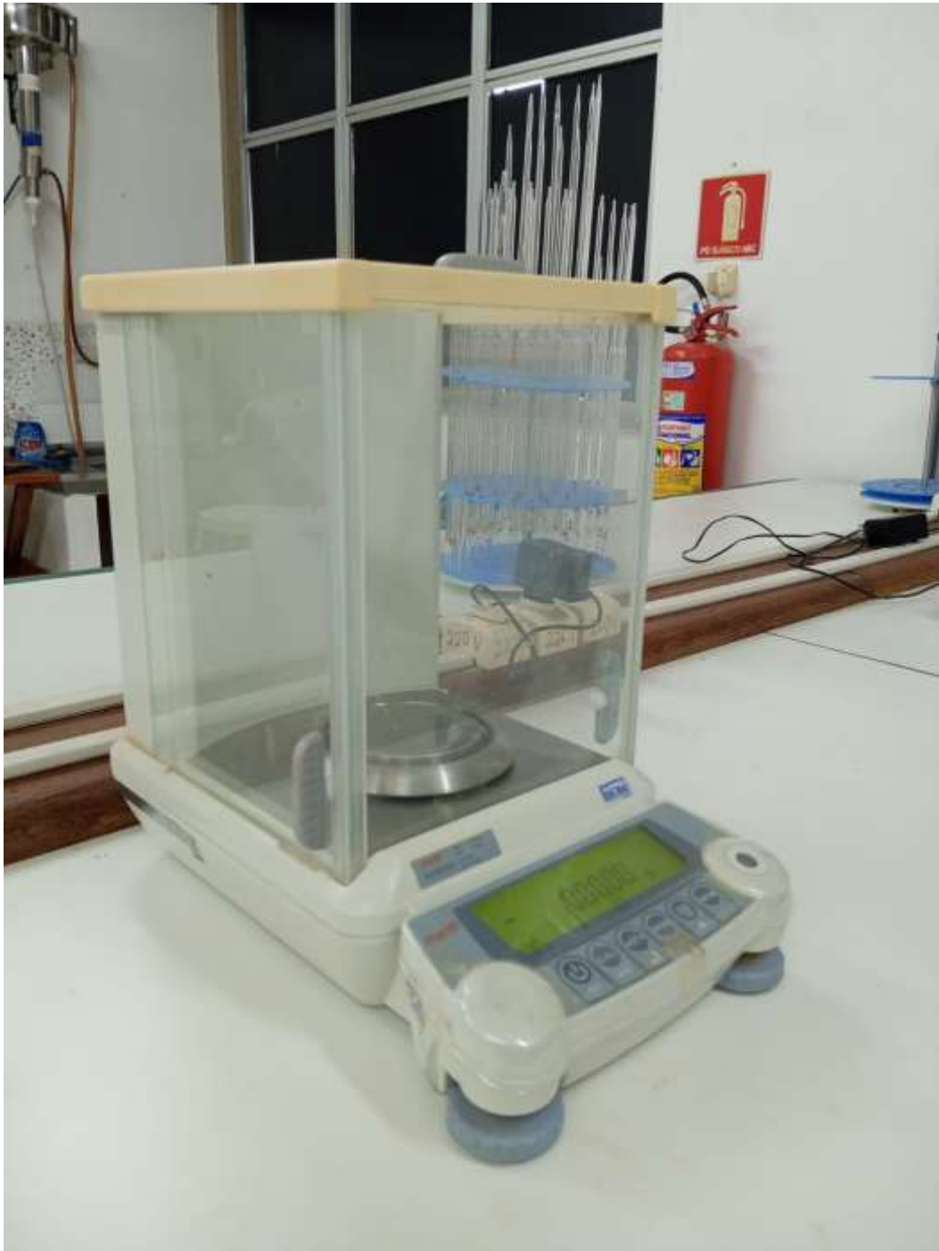
Figura 9 - Balança analítica de precisão.