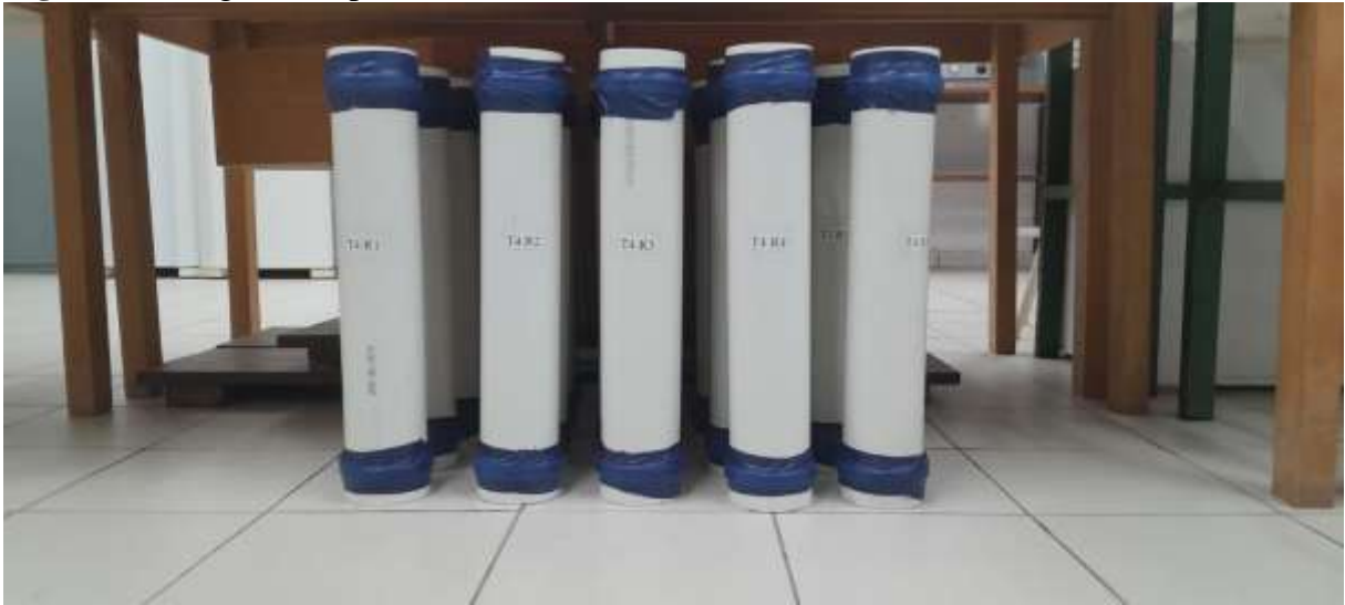
Figura 3 - Silagem compactada, minisilos vedados.

A imagem 3 apresenta mini silos devidamente compactados e vedados, prontos para o processo de fermentação. Cada unidade encontra-se lacrada com fita adesiva nas extremidades, garantindo a vedação hermética necessária para evitar a entrada de ar e assegurar condições adequadas ao desenvolvimento da ensilagem. Os tubos estão organizados verticalmente, identificados com rótulos que indicam os tratamentos e repetições experimentais, demonstrando organização e padronização do procedimento.