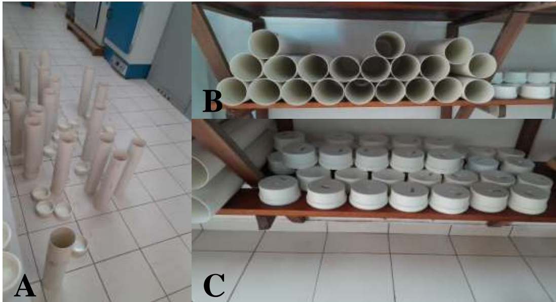
Figura 1 - A - Organização e higienização dos minisilos; B - Armazenamento e secagem dos minisilos; C - Tampas do mini silos.

A Imagem 1 apresenta etapas do preparo e manejo de mini silos utilizados em experimentos de conservação de forragens. Em A , observa-se a organização e higienização dos minisilos, dispostos no chão após o processo de limpeza, garantindo condições adequadas para uso experimental. Em B , os minisilos já limpos estão armazenados e posicionados para secagem, acomodados de forma ordenada nas prateleiras para assegurar ventilação e evitar contaminações. Já em C , encontram-se as tampas dos minisilos, igualmente organizadas em prateleiras, permitindo facilmente identificação, acesso e manutenção da integridade dos materiais antes do fechamento dos silos.