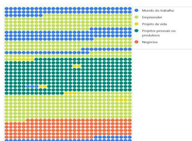
Figura 1 – Retrato da Proposta Curricular e Pedagógica do Ensino Médio do Amazonas, 2021.

É possível identificar a influência dessa ideologia no documento Proposta Curricular e Pedagógica do Ensino Médio (2021) destacado a seguir, no qual se evidenciam termos como projetos pessoais e produtivos, mundo do trabalho, empreender, negócios e projeto de vida. Observa-se tal coisa no retrato do documento (Fig. 1) via programa computacional de análise de dados.