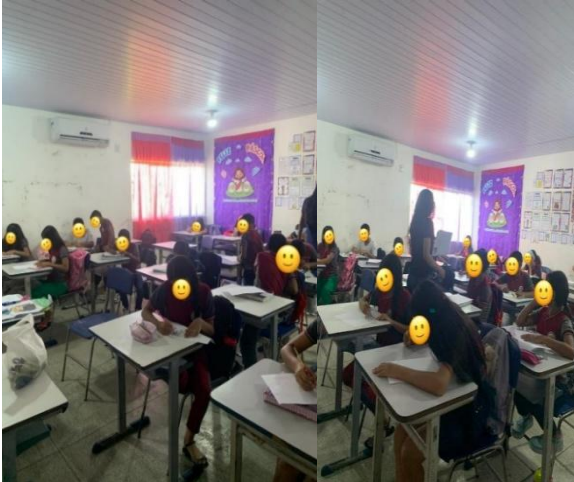
Imagem 5: Minha Lembrança da Pandemia (Coisas Boas)