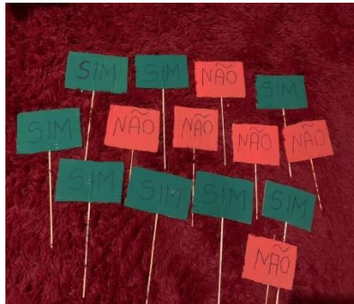
Imagem 7: Jogo interativo intitulado "Sim ou Não – Ensino na Pandemia e Pós-pandemia"

A imagem 7 apresenta um jogo interativo com perguntas relacionadas ao período da pandemia e ao contexto pós-pandêmico. A atividade promoveu a participação ativa dos estudantes, estimulando a reflexão, o diálogo e a socialização de experiências, além de favorecer a construção coletiva do conhecimento.