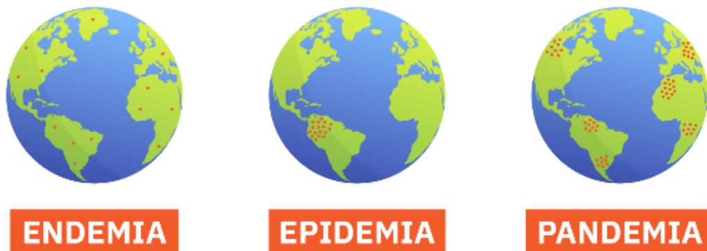
Imagem 1: representação do avançado do Covid-19

Antes de tudo, a imagem 1 a seguir demonstra como ocorreu a propagação do vírus em suas diferentes definições ao longo da história passando por endemia, epidemia e pandemia, evidenciando a forma como a doença foi surgindo e se expandindo ao longo do curto período de tempo.