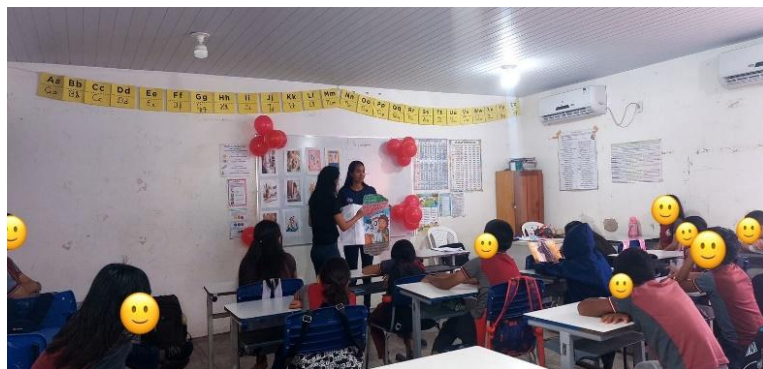
Imagem 4: Leitura compartilhada do livro “JOSÉ”.

A imagem 4 apresenta um momento de leitura coletiva de um livro que aborda a história de José, personagem que enfrentou a doença da COVID-19.