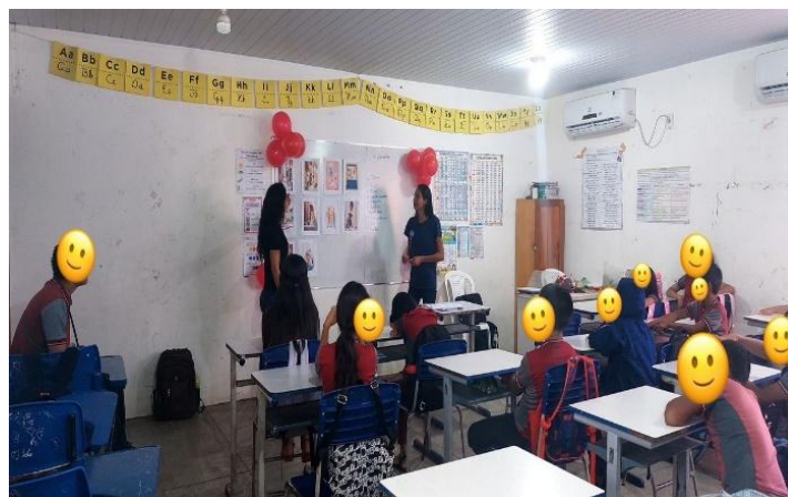
Imagem 3: Acolhimento e Conversa Inicial

A imagem 3 ilustra um momento de roda de conversa, caracterizado pela atenção e escuta ativa dos estudantes que vivenciaram o período da pandemia.