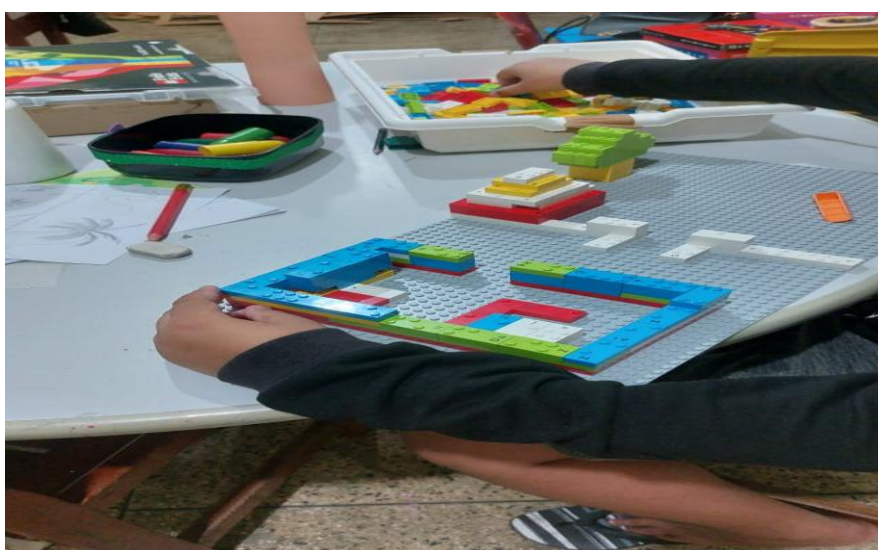
Figura 3 – Atividade Lúdica na Sala de Recurso

Ao ser questionado sobre as metodologias utilizadas no ensino da arte para contribuir com a escolarização da criança com TEA, respondeu: “Atividades que relacionam com o dia a dia do estudante, nas pinturas, nos recortes e colagens, conforme as vivências de suas rotinas”. Na Figura 3 , abaixo segue exemplos de atividades realizadas em sala de aula.