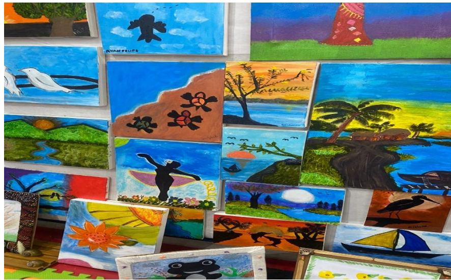
Figura 6 – Exposição dos desenhos do Projeto Arte Terapia I