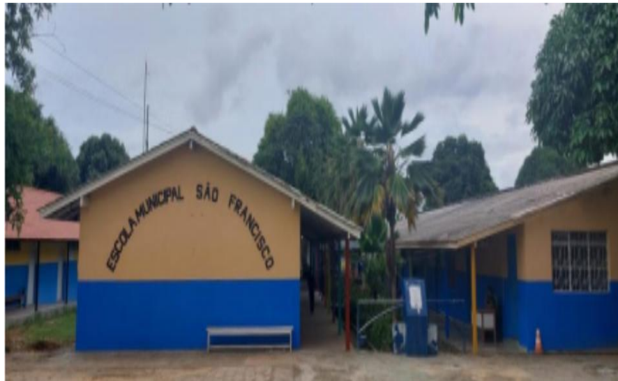
Figura 1: Mapa de Parintins-Am