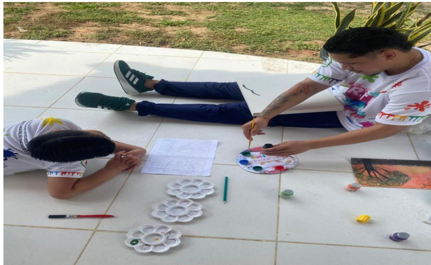
Figura 7: Atividade do Projeto Arte Terapia.