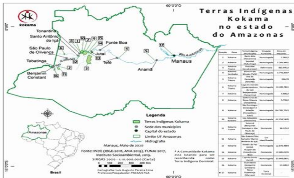
Figura 1 – Mapa de localização do povo kokama

O povo indígena kokama se encontra localizado no estado do Amazonas e com maior concentração nos municípios do Alto Solimões (ver figura 1)