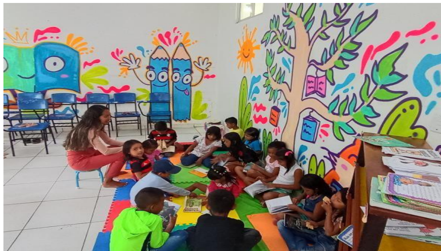
Figura 10 - Momento do círculo

Em continuidade ao trabalho, organizei um círculo e coloquei diversos livros no centro, pedindo que cada estudante escolhesse um exemplar. Em seguida, solicitei que lessem apenas o título, pois não haveria muito tempo para a leitura completa. Muitos alunos demonstraram dificuldade na leitura dos títulos, e apenas um ou dois conseguiram realizar a leitura de forma adequada. Observei também que vários se mostraram tímidos durante essa etapa. Nas imagens mostrara o momento do círculo.