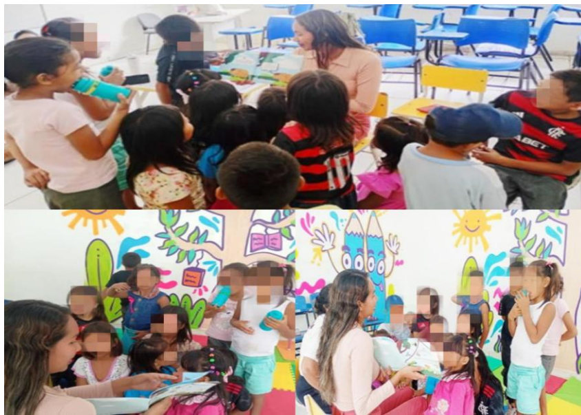
Figura 11 - Leitura do livro ilustrado dos animais

Logo depois, utilizei um livro ilustrado contendo fotografias de animais da Amazônia. Pedi que identificassem os animais e reconhecessem a letra inicial do nome de cada um. Percebi que muitos não conheciam alguns dos animais apresentados, mas, mesmo assim, tentavam nomeá-los. Alguns estudantes conseguiram ler corretamente, outros leram com dificuldade, porém demonstraram esforço e empenho. Quanto à identificação de letras iniciais e finais, mostraram maior facilidade e rapidez. As imagens mostraram a leitura do livro ilustrado com os animais.