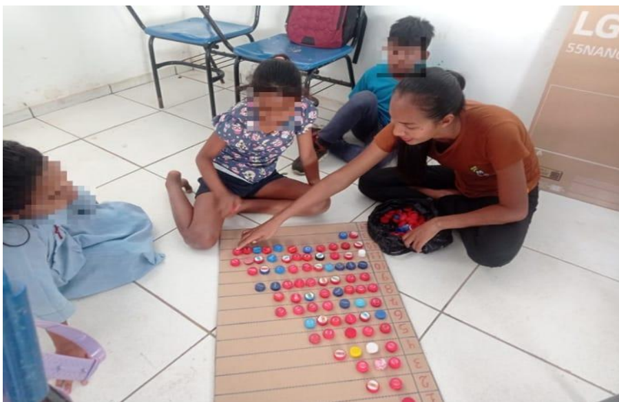
Figura 5 - Jogo de matemática

Sobre os jogos matemáticos eram confeccionados pela professora em sua casa em papelão colocava a numeração de um a trinta e eram feitos da seguinte forma como mostrara a imagem.