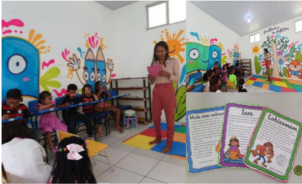
Figura 6 - Momento da Leitura