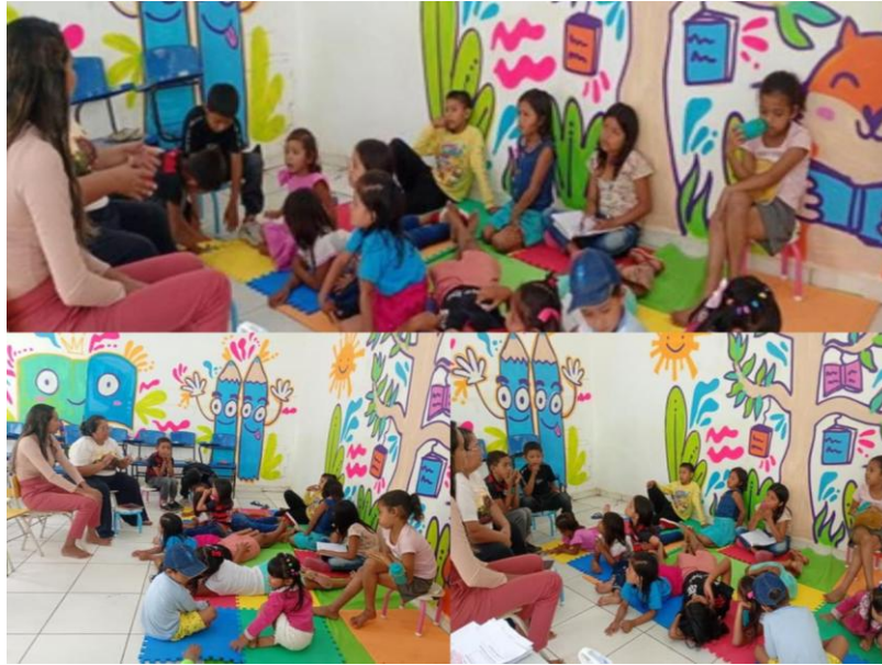
Figura 12 - Contação da lenda Mapinguari