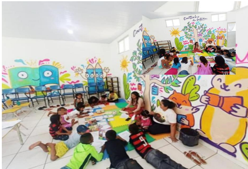
Figura 8 - Momento da contação da história da Iara

Após coletar as produções, retomei especificamente a leitura da lenda da Iara. Durante essa releitura, realizei perguntas ao longo da narrativa para estimular a interpretação e promover maior participação dos alunos. E assim tornar a história dinâmica e interativa entre professor e aluno.