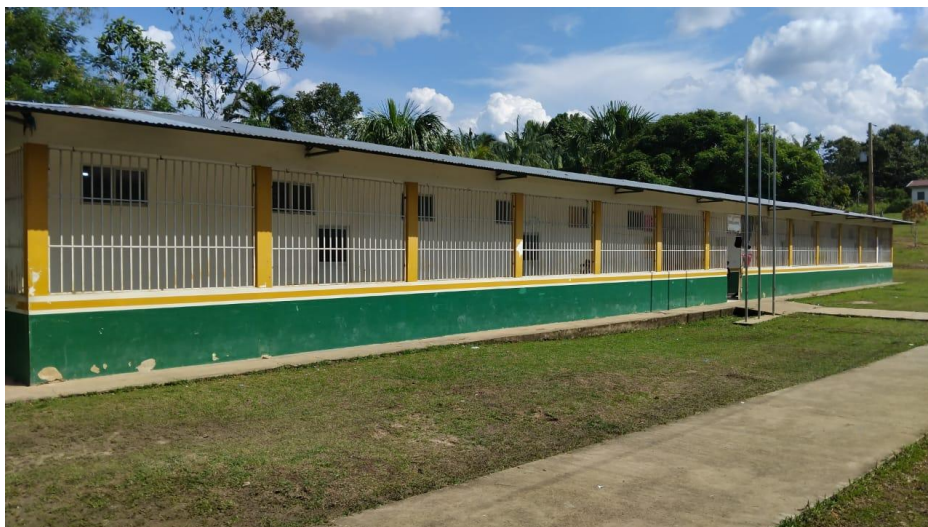
Figura 3 - Escola Municipal Indígena Antiri Awanari Tsamia

Nesta comunidade, se encontra a escola municipal indígena Antiri Tsamia (ver figura 2), esta foi lócus de estudo no decorrer do curso de Pedagogia.