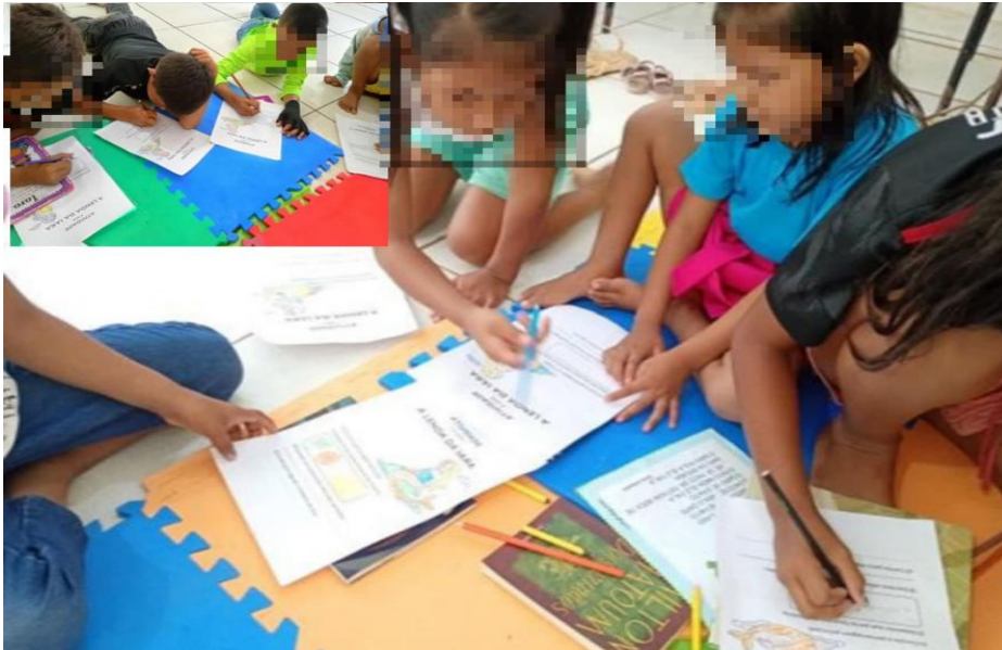
Figura 9 - Momento da pintura da sereia