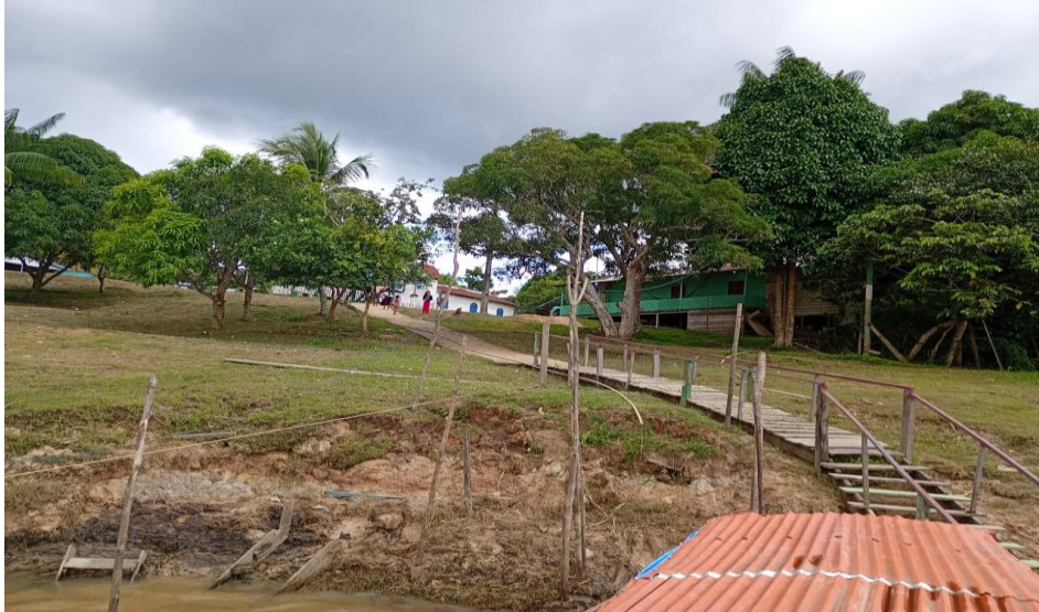
Figura 2 – Comunidade Guanabara II.

A pesquisa se realizou na Escola Municipal Antiri Awanari Tsamia (ver figura 1), localizada na Zona Rural da Comunidade Indígena Kokama de Guanabara II (ver figura 2), sem número, do município de Benjamin Constant Amazonas com CEP 69630-000, localizada na zona rural nas margens direita do Rio Solimões.