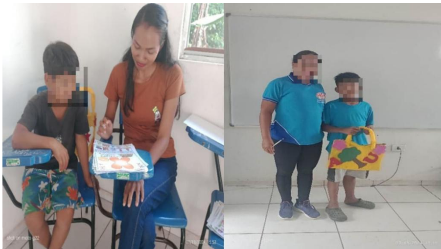
Figura 4 - Entrega da mala com o alfabeto B e mostra do alfabeto que aprendeu

A mala viajante foi um projeto criado pela professora, visando que muitos alunos tinham dificuldade com a leitura ou desinteresse pelos livros. O projeto ocorreu de duas formas, os alunos que já tinham domínio da leitura sendo ela fluída levavam a mala com o livro sobre uma histórico infanto-juvenil. Já as crianças que ainda estavam em processo de aquisição da leitura, recebiam também a mala viajante, porém, para eles era enviado com o alfabeto acompanhado de folhas impressas com a junção das sílabas.