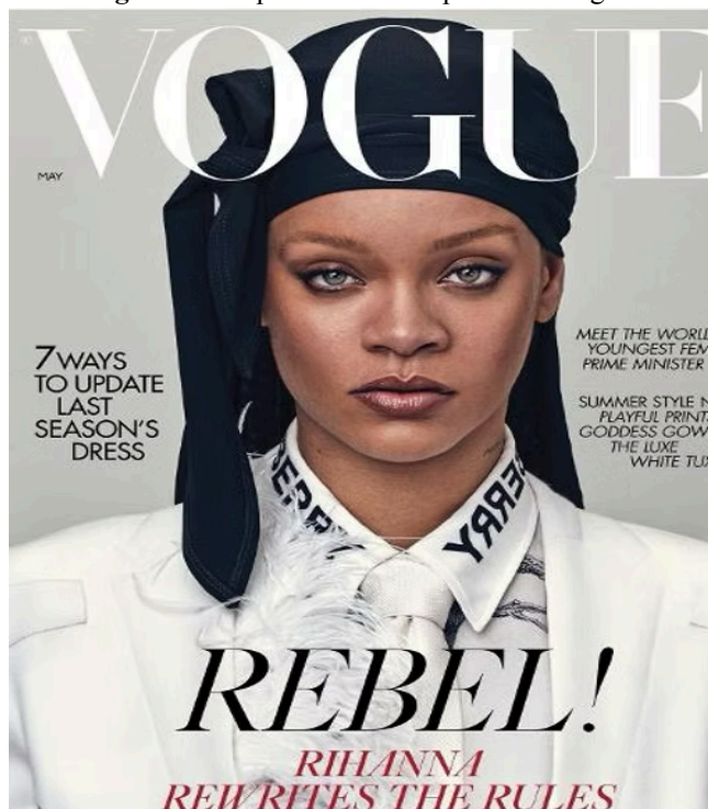
Figura 4 – Capa da revista impressa da Vogue.