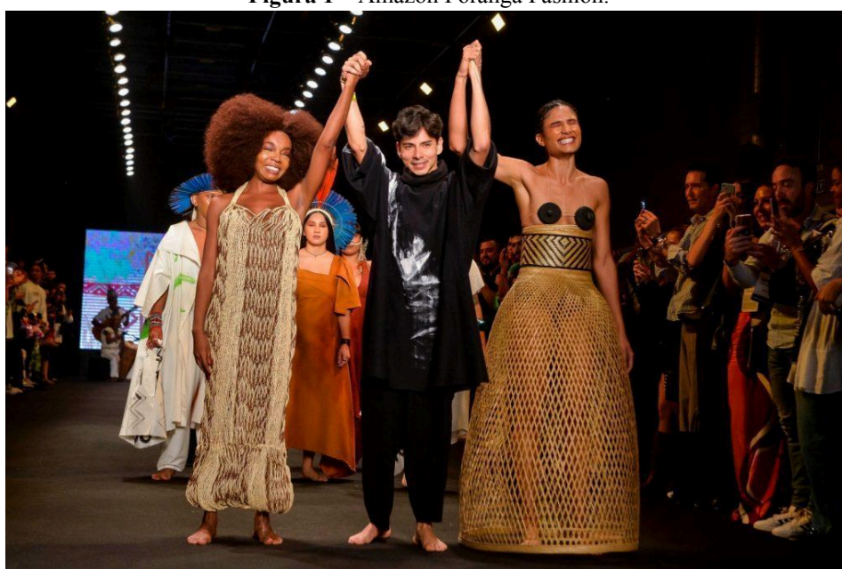
Figura 1 – Amazon Poranga Fashion.

O trabalho de propagandistas voluntários no final do século XIX influenciou a projeção da Amazônia como terra de recursos e belezas exóticas, consolidando estereótipos que persistem na moda contemporânea (Coelho et al., 2007). A retórica promocional daquele período alimentou uma visão de abundância natural que hoje surge reinventada em estampas e padronagens. Esse legado histórico confirma a interseção entre marketing territorial e design de moda.