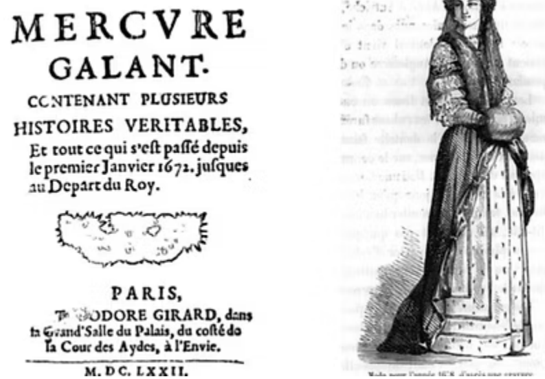
Figura 3 – Transição nas revistas de moda: do papel à tela (Imagem da primeira revista de moda).